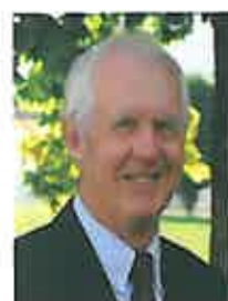
Robert Middleton Municipal

Forêts, pâturages Espaces verts Eclairage public, services électriques Routes Mobilité